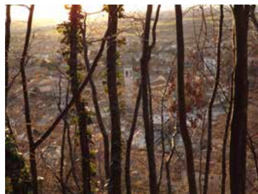
3° classificato Nicole Speranza